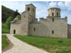
Манастир Ђурђеви Ступови, Беране

ли су бити упознати са припремама за општи устанак. Индиције говоре да су постојале чврсте везе манастирског братства Ђурђевић Ступова са манастирима Морачом, Острогом и Пивом, а нарочито са Пећком патријаршијом и Дечанима. Васојевићи су одржавали и непосредне везе са појединим првацима у Србији, у првом реду са људима њиховог племенског поријекла, што ће нарочито доћи до изражаја током самога устанка. Сличну улогу су имали главари Дробњака за Херцеговину. Игуман манастира Ђурђеви Ступови, Мојсије Зечевић је био световни и духовни владар племена Васојевића с краја осамнаестог и почетком деветнаестог вијека. Уз Петра Првог и Петра Другог Петровића Његоша био је једна од најзначајнијих личности Црне Горе. Успоставио је везу између Црне Горе и Србије и помагао Карађорђевој устанак. Обављао је значајне државничке и световне дужности у вријеме Петра Другог Петровића. Учинио је много на уједињењу Васојевића и других брдских племена у једну државу Црну Гору. Мојсије Зечевић је обновио «Васојевићког закона у дванаест точака» (тачака). Писао је молитве и епске пјесме које су забиљежили његови савременици, а међу њима и Сима Милутиновић Сарајлија. Преко педесетак његових епских пјесама објављено је у разним листовима и антологијама. 44