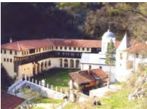
Манастир св Тројице, Пљевља

О приликама које су у овом периоду владале у подручју Полимља и Потарја свједочи један натпис са зида манастира Мораче. Непознати хроничар 1803. године записао је да тада бјеше велика глад и „ велико крволиптије “ и да „ гори бјеше немир него глад “. 42 Изгледа да ни претходна 1802. година није била боља, о чему су савременици оставили податке у књигама манастира Свете Тројице код Пљеваља и Никољца код Бијелог Поља. Подручје Колашинске капетаније било је крваво ратно поприште. Изазивач нереда било је тамошње муслиманско становништво. Ратовало је село са селом, братство са братством, а сви скупа са органима мјесне власти. Пљачке, крађе и убиства биле су свакодневна појава. Немири у Колашинској капетанији уносили су смутњу и у Бјелопољски и Пљеваљски крај. Почетком Првог српског устанка немири су престали јер су сукобљени муслимани схватили да им устанак представља заједничку опасност. До тада је долазило и до савезништва између православаца и муслимана и заједничког иступања против неког другог села, било православног или муслиманског. Међутим, избијањем устанка народ се обједињавао по конфесијама.